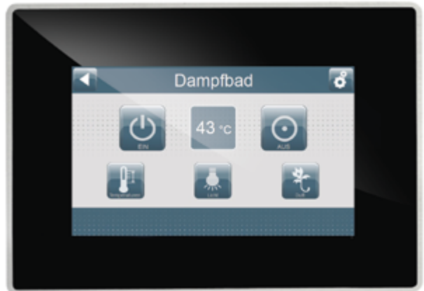
Touch Display, 4,3", 64000 Farben